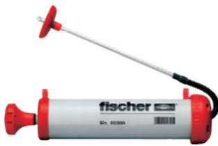
Ausbläser AB G